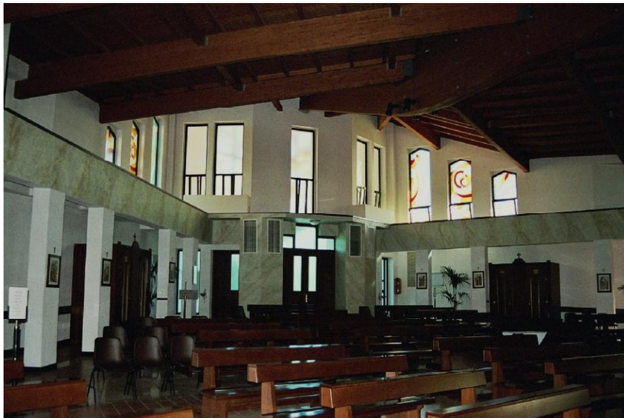
Vista dell'ingresso principale sempre decorato a stucco con tecnica del "finto marmo".