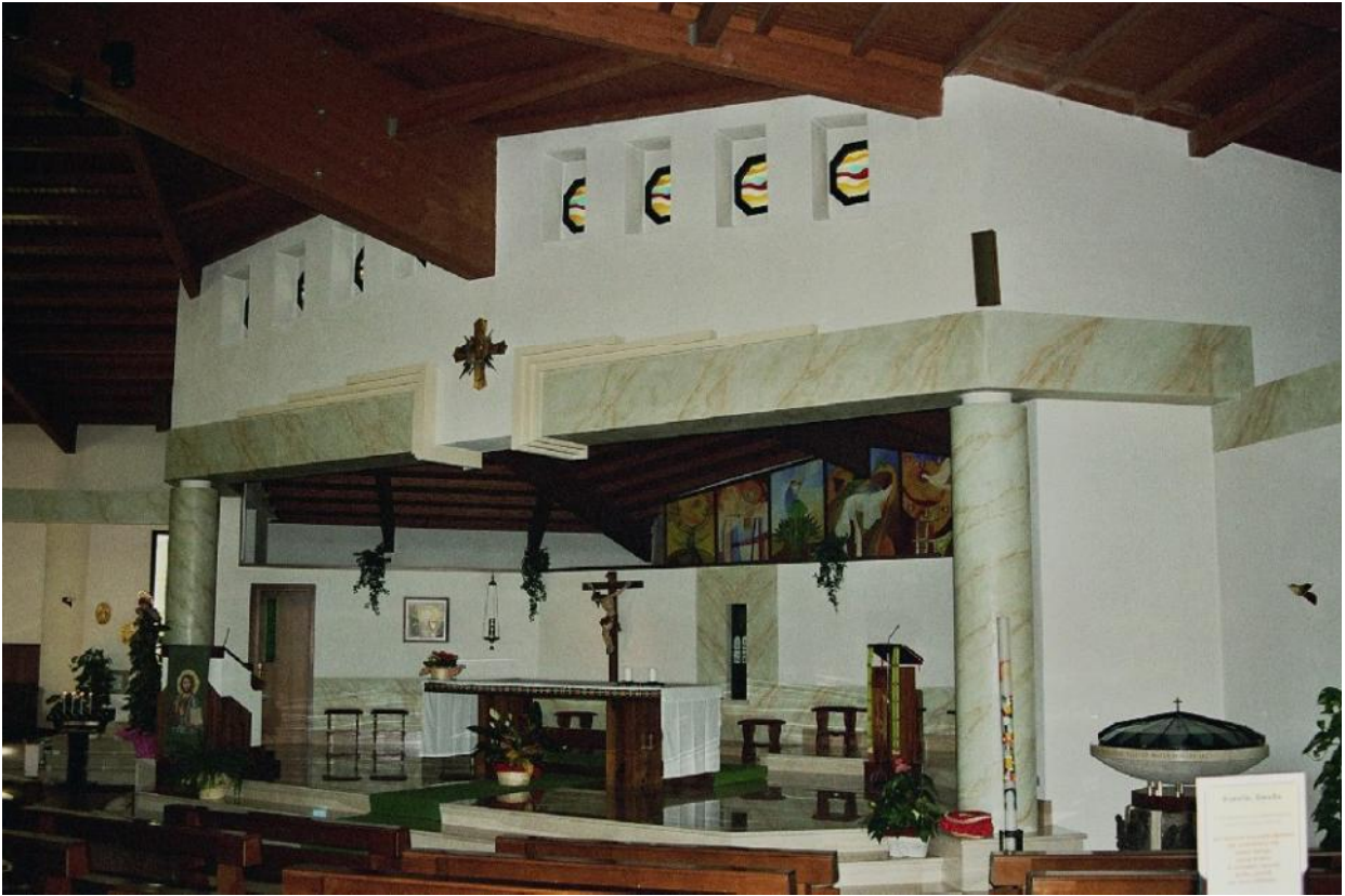
L'altare maggiore decorato a stucco con la tecnica del "finto marmo".