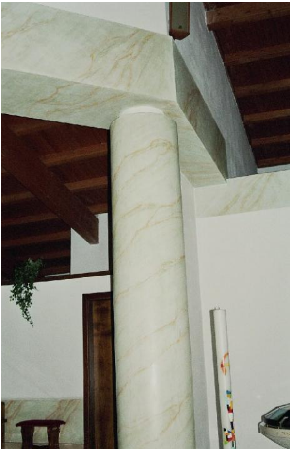
Particolare di una colonna dell'altare