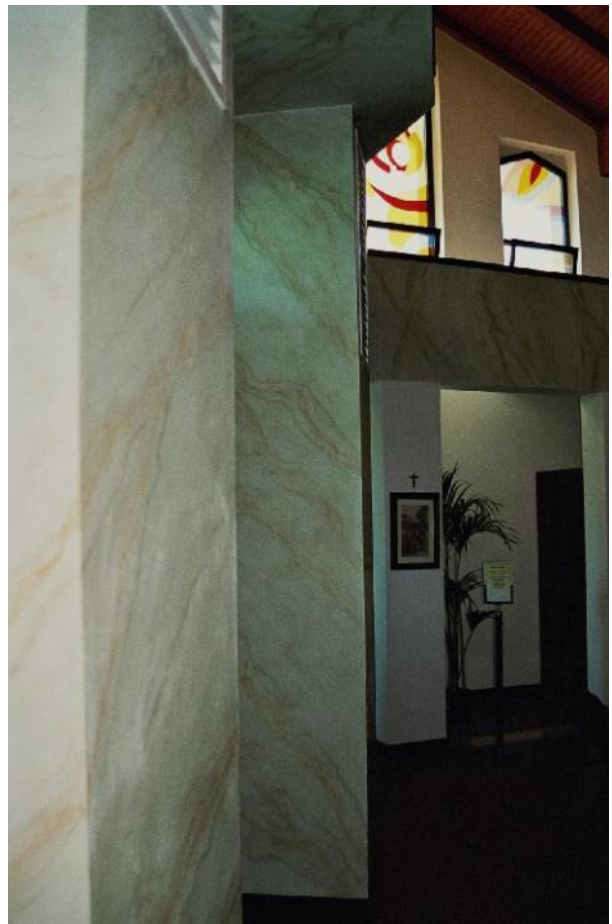
Particolare del portale d'ingresso